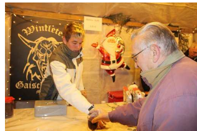
Maulburg Maulburger Weihnachtsmarkt