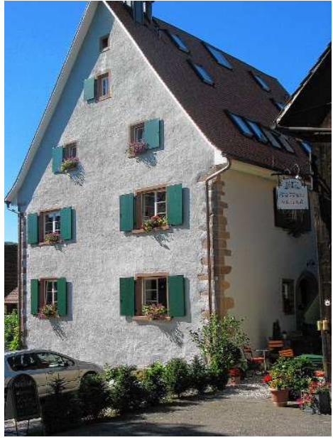
Das Hotel-Restaurant „Pfaffenkeller“